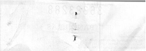
PLAZA DE CORRO No. 152 UERMOOTILIC